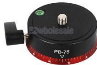
Ca. 700 kr

Desuden bør man anvende fjernudløser, og pol-filter, ND / ND gradueret filter kan også være meget anvendelige.