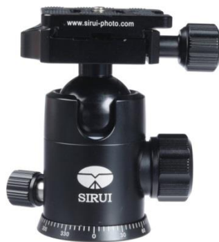
Ca. 1050 kr